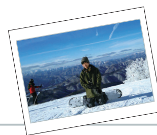
休日は雪山へ出かけ、スノーボードを楽しんでいます！また、有給休暇を使って、毎年欠かさず北海道のスキー場へ行っています。

若手でも裁量を与えられた仕事ができることです。当社より大きなクレジットカード会社は多くありますが、会社が大きくなればなるほど、仕事は分業化され、担当する業務の幅や、与えられる裁量は小さくなります。当社のカード会員が約500万人いる一方で、従業員数は約400名程度で多くはありません。そのため、一人一人の仕事の幅も広く、一定の裁量を与えられた仕事ができます。また、先述の通り、チャレンジ精神があれば、活躍の場が大いにあることも当社の魅力の一つです。