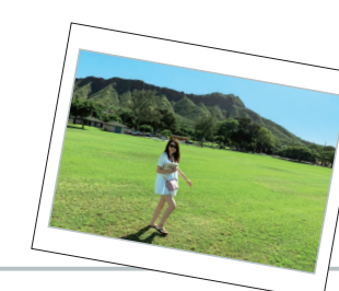
コロナ以前は有給休暇を利用して、1週間のハワイ旅行へ行きました！年数回の旅行などでリフレッシュしながら、日々の業務を頑張っています！

提携先様のニーズをいかに捉えられるかがこの仕事のやりがいだと感じています。提案営業においては、提携カードの魅力をお伝えするために、提携カード発行による効果をどれだけ具体的に提案できるかが重要です。そのためには提携先様の事業内容、営業戦略などをリサーチし、当社の提携カードがどのように貢献できるか、どのようなスペックであればお客様を増やすことができるかなどを検討していきます。検討を重ねたご提案内容で、提携先様のご賛同を得られたときはとても達成感があります。