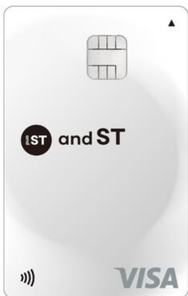
and ST CARD white

ポケットカード株式会社（本社：東京都港区、代表取締役社長：高垣 晴雄、以下「ポケットカード」）は、アンドエスティ HD グループでモール&メディア事業やプロデュース事業を展開する株式会社アンドエスティ（本社：東京都渋谷区渋谷 2-21-1、代表取締役社長 CEO：木村 治、以下「アンドエスティ」）と提携し、2025 年 12 月 1 日より「and ST CARD」の募集を開始いたします。